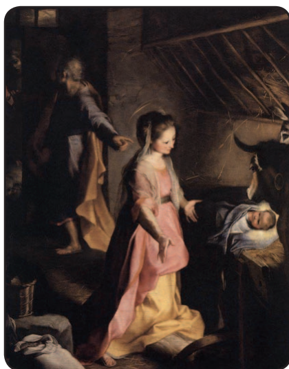
Federico Barocci, Natività di Gesù

Con la nuova polizza attivata dalla sede centrale ogni socio, regolarmente iscritto, è automaticamente assicurato per gli infortuni che dovessero occorrergli nello svolgimento di tutte le attività organizzate dalla sottosezione e per un eventuale recupero da parte del soccorso alpino. I non soci o i soci non in regola con l'iscrizione, che intendano partecipare alle attività, devono obbligatoriamente stipulare una polizza assicurativa con la sottosezione - del costo di € 8,00 - almeno 48 ore prima dell'inizio dell'attività a cui si intende partecipare.